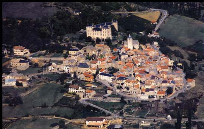
Vue d'ensemble du château dominant le village de MOSTUEJOULS. On distingue nettement les terres et jardins qui entouraient le château au Nord, au Sud et à l'Ouest.