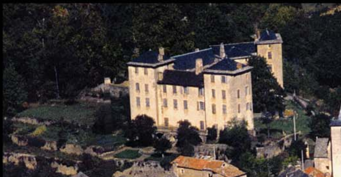
Levezoux, d'Estaing, Vezins, Hauts barons et Mauvoysins, Mostuejoul et d'Arpajon, forts châteaux et beau renom. Sévérac torture et pille, Castelnaud sur tous grapille, et Vitracq est sans rayon pour se prétendre baron. (Marot, Voyage en son pays de Roargue)