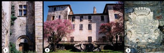
1 - Portail Roman avec tympan monolithique : entrée de la 1 ère Eglise du château primitif - XII ème s. 2 - Grande Façade Méridionale du château avec rez de terrasse, la bibliothèque et la grande Salle. Au 1 er étage, de gauche à droite : chambre de mademoiselle, salle à manger, salon de compagnie, antichambre et chambre de M me la Comtesse. Au pied de la terrasse : grand escalier en fer à cheval. 3 - Blason armorié des De MOSTUEJOULS ornant la fontaine du parc Nord - aménagement de 1777.

Plan de la chapelle avec coupes longitudinales et coupe transversale. L'édifice comprend 3 travées séparées par de forts arcs doubleaux. L'ensemble (ainsi que la porte d'entrée), a toutes les caractéristiques de l'architecture romane.