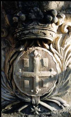
ARMES : De gueules, à la croix fleurdéliée d'or, cantonnée de quatre billetes du même. Couronne de comte. SUPPORTS : Deux lis au naturel. L'écu environné du manteau de pair sommé de la toque du baron.