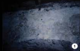
1 - Mur Nord : motif géométrique tenu par 2 femmes