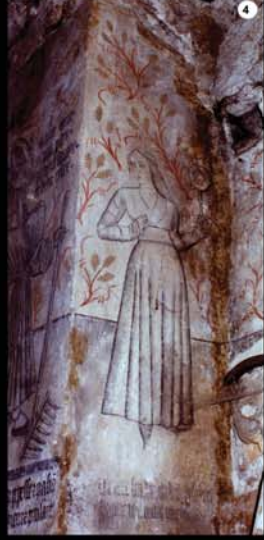
4 - Vertu de Tempérance ?