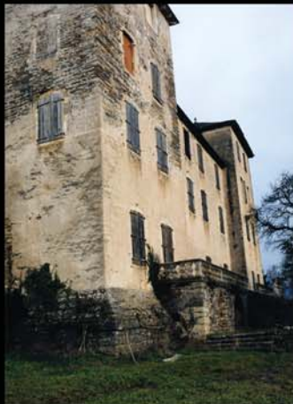
Grande façade Sud-Ouest et Perron sur le Parc