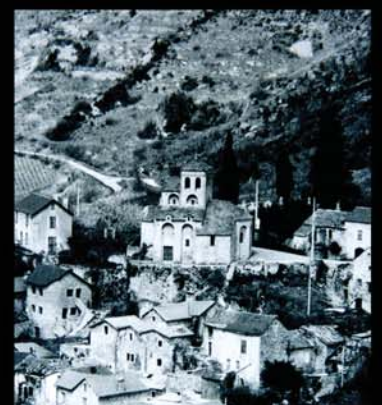
Vue aérienne du Village avec façade Sud de l'Eglise