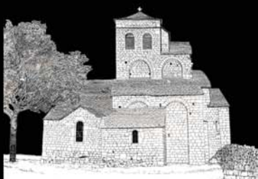
Croquis Façade Nord de l'Eglise avec ses appentis