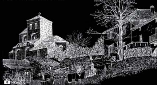
8 - Croquis de l'Eglise depuis le village