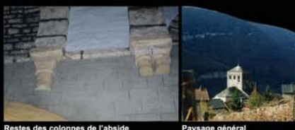
Restes des colonnes de l'abside