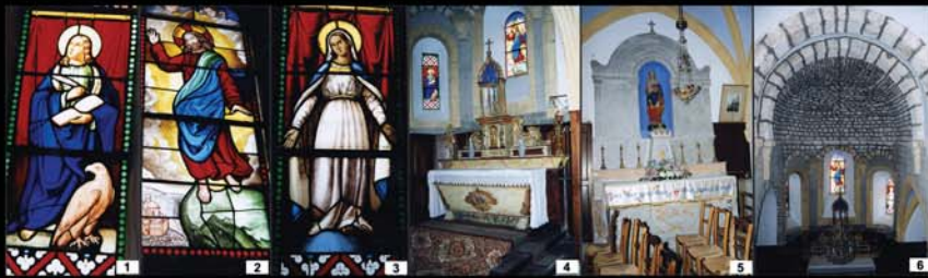
1 - Vitrail de St Jean l'Evangeliste 2 - Vitrail de l'Ascension, fond d'abside 3 - Vitrail de la Vierge 4 - Maître autel, retable et ciborium

Le clocher de plan barlong, s'élève sur la première travée de nef ; il est orné d'une série de baies en plein cintre, fermées d'abat-son.