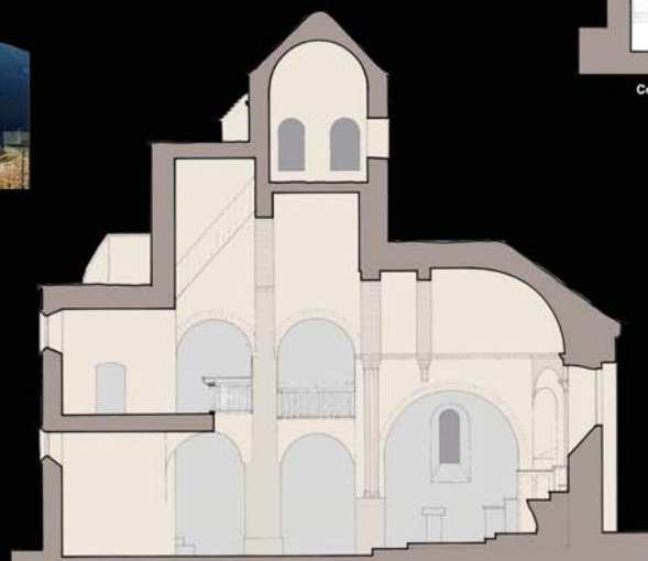
Coupe longitudinale - vue vers le Nord - dessin Bâtiments de France