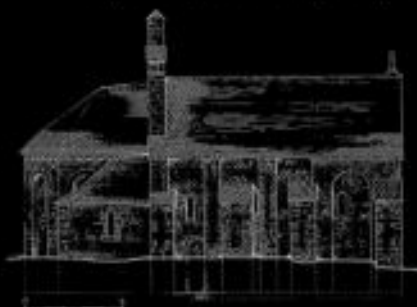
Élévation Nord de l'Eglise - dessin ACMH