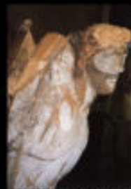
Christ XV e s (classé MH)