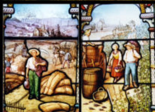
Notre Dame des Champs dans son environnement de champs de blé et de vignobles, tels que l'a illustré le Maître verrier de Grenoble sur les vitraux des absidioles