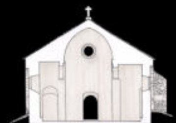
Coupe transversale de la Nef, vers le massif occidental dessin ACMH

■ XI e ■ XII e ■ XIII e - XIV e ■ XIV e ■ XV e - XVI e