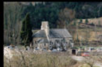
Notre Dame des Champs dans son environnement au milieu des tombes des habitants du lieu