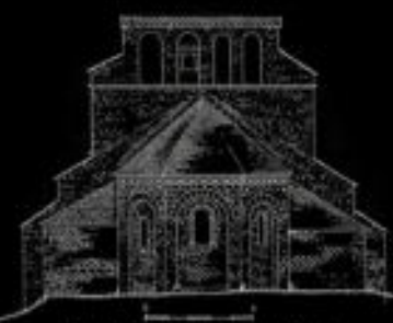
Élévation Est - Chevet - dessin ACMH