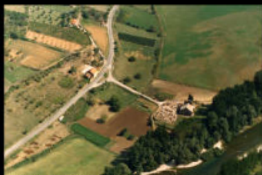
Photographie aérienne du Site de Notre Dame des Champs - 1984