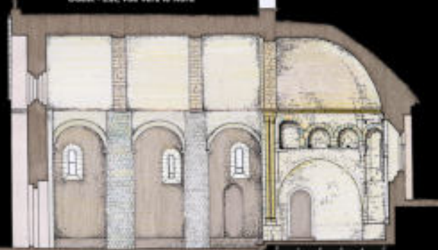
Coupe longitudinale sur l'Eglise suivant l'axe Ouest - Est, vue vers le Nord